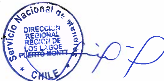
LILIAN PEÑA CASTILLO Directora Regional Servicio Nacional de Menores Sename. Los Lagos